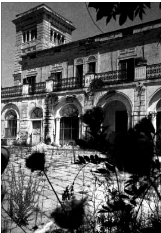
Casamicciola - Albergo Savoia

Viene così riportata la versione integrale scritta da Pasolini con numerosi brani inediti, omessi precedentemente, e foto in ognuna delle quali «spero ci sia un'eco di ognuna delle sue parole» (Séclier). Sono inoltre riprodotti anastaticamente i fogli battuti a macchina da Pasolini.