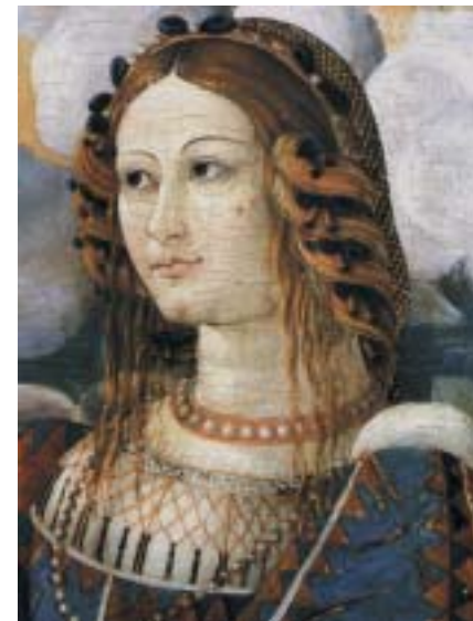
Vittoria Colonna - Particolare della Madonna delle Grazie e committenti (Ischia, Chiesa di Sant'Antonio)

infiammava d'ardore per la guerra, la seconda si sentiva maggiormente attratta dalla dolcezza delle muse, se Sannazaro, Cariteo, Rota, Bernardo Tasso, declamavano i loro versi, o se Musofilo, Filocalo, Giovio (7), Minturno discutevano della cultura umanistica. (...) In questa schiera d'élite, sebbene la duchessa di Francavilla occupasse il primo posto e Vittoria Colonna vi brillasse più di tutte, vi si trovavano in gran numero altre nobili dame di Sicilia e di Napoli che per la loro intelligenza ben ne facevano parte. Il nome d'Ischia era allora famoso dappertutto, come punto d'incontro di tanta grazia e di tanta gloria» 8 .