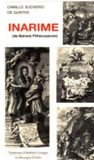
Frontespizio di Inarime o i Bagni di Pitecusa di Camillo Eucherio de Quintis nella traduzione dal latino da Raffaele Castagna, 2003.

Il De Rimedi di Iasolino è il «primo libro che tratti solo dell'isola d'Ischia: non solo ne descrive i rimedi, valorizzando il ricco patrimonio balneologico, ma ne delinea anche una sintesi di carattere storico e ne fa una prima descrizione geografica a cui tutti continuarono ad attingere per almeno due secoli dopo di esso» 4 .