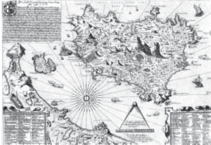
Mario Cartaro, Carta dell'isola d'Ischia , 1586, allegata alla prima edizione (1588) del De rimedi naturali di Giulio Iasolino

caso di locus terribilis incendii saxorum vulgo le cremate, attribuito alla colata dell'Arso. La parola vulgo introduce anche altrove il nome locale. I centri abitati sono preceduti da pagus , vicus , e solo Ischia è civitas 4 .