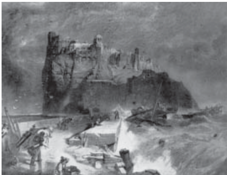
Il Castello durante le guerre napoleoniche (foto Lembo da una stampa inglese del tempo, in Gina Algranati, Ischia , op. cit.)

de intus castro nostro gironis, una cum omnes peculias et mobillas seu horganeas..." (... e parimenti offriamo l'intera nostra casa esistente sul nostro castro gironis con tutti i beni, mobili, giare...).