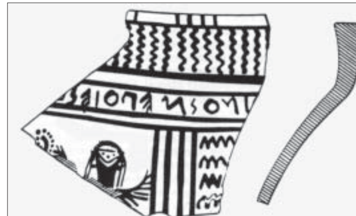
Frammento dell'orlo di un cratere LG locale con iscrizione dipinta, retrograda: ... inos m'epois(e) = ... ino mi fece (in D. Ridgway - L'alba della Magna Grecia , Longanesi 1984). Il Peruzzi pose l'attenzione sulla figura in basso, considerata una scimmia.

Circa l'etimologia di Pitecusa, derivata ora a simiarum multitudine (la presenza delle scimmie), ora a figlinis doliorum (le fabbriche di anfore), «c'è una terza possibi-